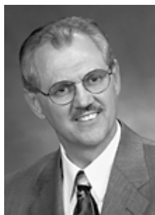
Ховард Янг, доктор христианского служения, президент Библейского колледжа Троицы, штат Северная Дакота

Смерть, воскресение, вознесение и обещанное возвращение Христа должны быть также сердцем и душой современной проповеди.