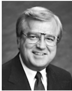
Рэй Рэйчерлз, суперинтендант Ассамблей Божьих в Южной Калифорнии.

«Все могу в укрепляющем меня Иисусе» (Фил. 4:13).