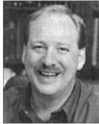
Рик Уоррен является пастором церкви «Сэддлбэк» в Мишн Вейхо, штат Калифорния.

Нашей целью мы ставим достижение этих задач. Наше видение в сфере духовного роста — воздать славу Богу, представляя Иисуса Христа в жизнях как можно большего количества истинных последователей до тех пор, пока Он не придет забрать Свою Церковь.