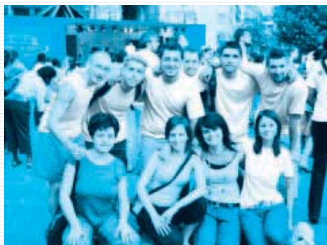
„A magyar csapat egy része. Gyalogolunk a missziómező felé.”