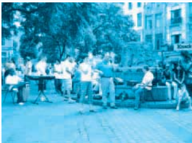
„Edit osztja meg bizonyágtételét az érdeklődőknek a Place Agorán. Ez volt délutánonként a magyarok helyszíne.”