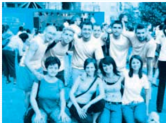
„St. Chatrine tér. Itt volt a legnagyobb evangélizációs megmozdulás. Háttérben a Gospel Vision missziós kamionja.”