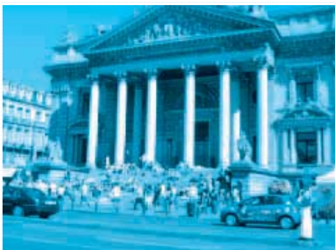
„A délutáni utcai evangélizációk másik helyszíne.”