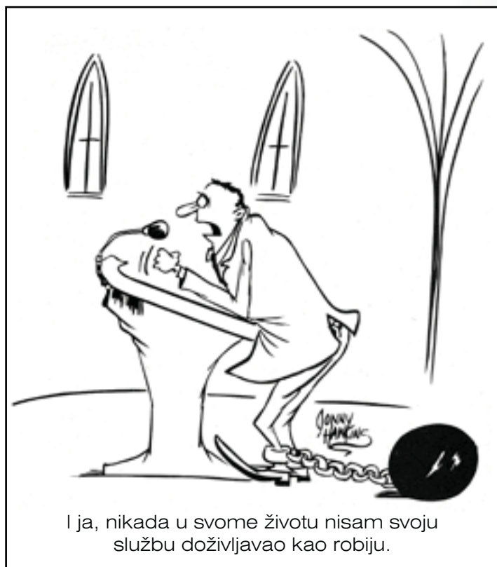
I ja, nikada u svome životu nisam svoju službu doživljavao kao robiju.

„Kad su se Moody i Sankey nakon te turneje koja je trajala od 1873. do 1875. vratili kući, praktički su postali nacionalni heroji,“ tvrdi George Marsden. 11 Pozivi da održe evangelizacije dolazili su iz Brooklyna, Phila-